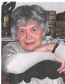
Polcz Alaine 1922-2007

Dsida Jenő (1907-1938) erdélyi magyar költő. Kora ifjúságától kezdve költőnek készült. Benedek Elek fedezte fel. A háború, a trianoni diktátum következménye és fiatakkori szívbetegsége rányomta bélyegét a költő életművére. A részvét, a szenvedőkkel való együttérzés költője volt, aki szeretettel fordult mindenki felé. Viszszatérő témái a hazaszeretet, a mély katolikus vallásosság, a szerelem és a halálfélelem.